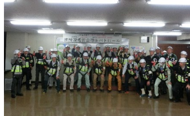
(写真 3) 「ご安全に運動パトロール」出発式風景