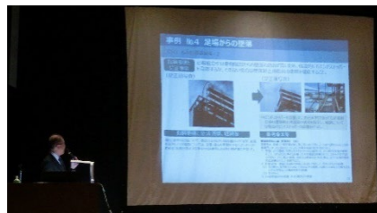
(写真 4) 「ご安全に運動研修会」風景