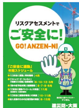
(写真 2) 「ご安全に運動」ポスター

「リスクアセスメントでご安全に！」のスローガンのもと平成 22 年度より年間を通じての運動と位置づけ、強調期間を設けて次の活動を実施した。分会の安全パトロールでは、「ご安全に運動」実施要領や「ストップ・ザ・ついで」リーフレットを配布するとともに、安全指導者がフルハーネス型安全帯の使用を呼び掛けた。また、全会員に「ご安全に運動」ポスター（写真 2）を送付し、運動の周知並びに推進に努めた。