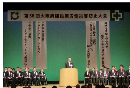
(写真 6)「第 58 回大阪府建設業労働災害防止大会」風景

第 1 部で行った支部表彰規程に基づく安全表彰の該当者は、功労賞 9 名、功績賞 28 名、優良賞会社 4 社、優良賞現場 52 現場である。